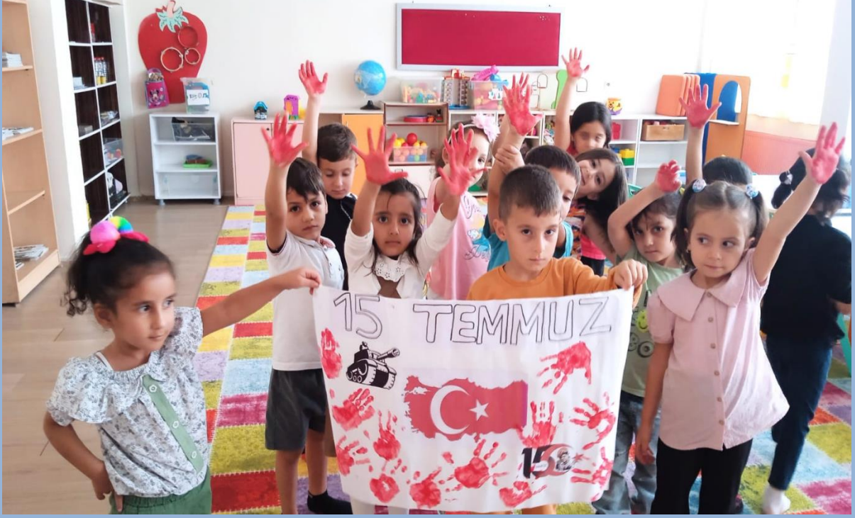
Anaokulu Resim etkinliklerimiz